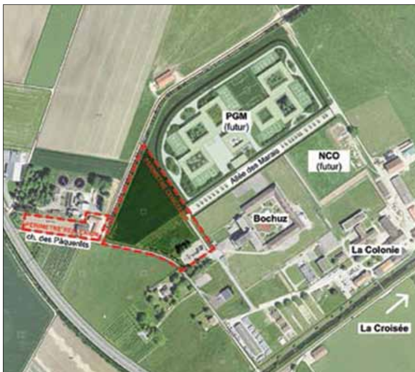
Localisation du nouveau poste.