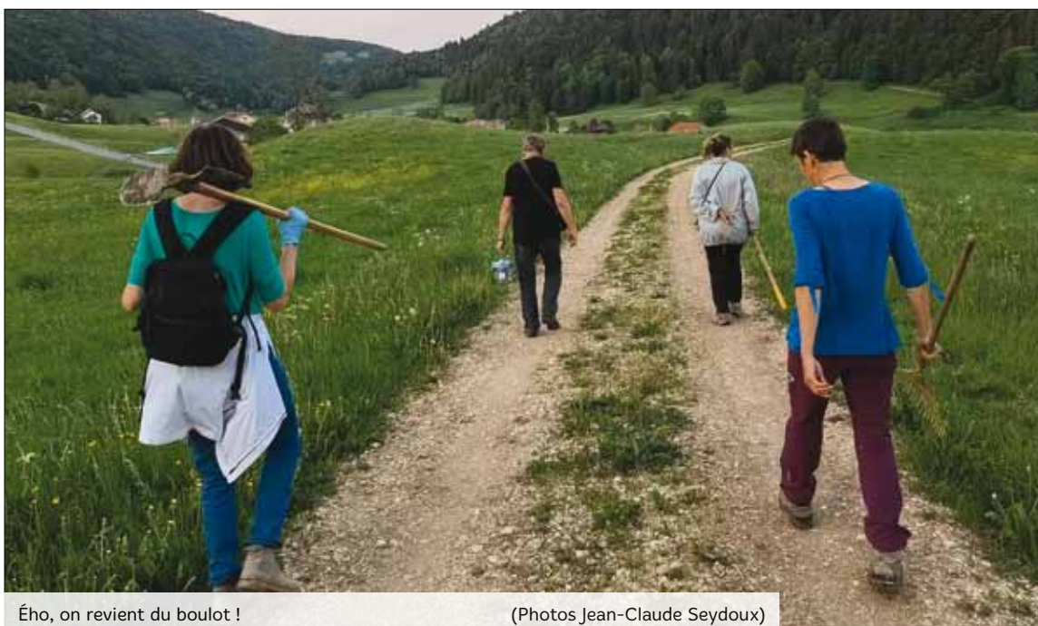
Ého, on revient du boulot !