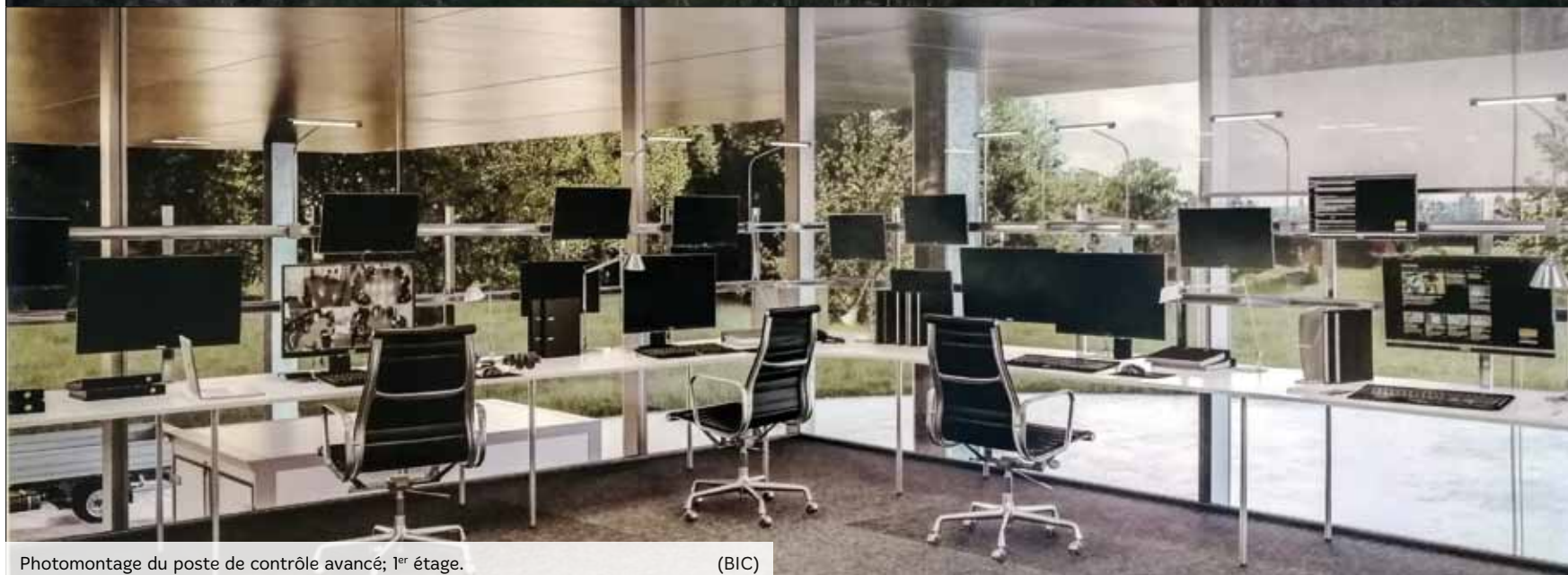
Photomontage du poste de contrôle avancé; 1 er étage.