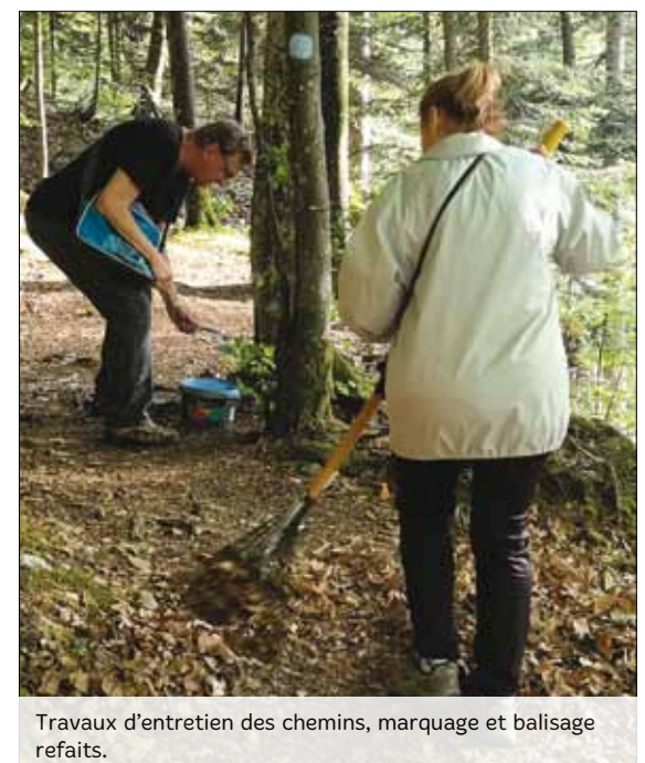
Travaux d'entretien des chemins, marquage et balisage refaits.