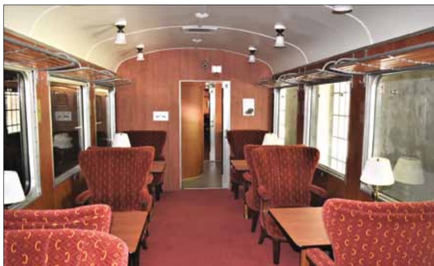
Voiture Pullman aménagée pour les personnes à mobilité réduite.

Pour davantage d'informations: http://trainvapeur.ch