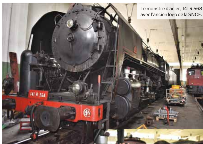
Le monstre d'acier, 141 R 568 avec l'ancien logo de la SNCF.